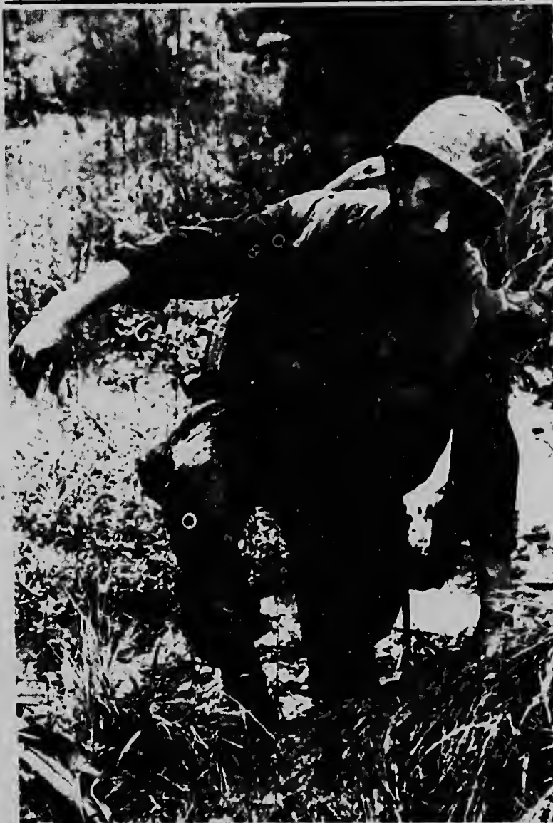
Un soldá mericano ta forzando su paso door di lodo qu ta yega te na su rudia durante un patrulla reciente den un plantacion di arros banda di e zona desmilita- risá banda di Gio Linh na Sur Vietnam. E tropanan mericano tabata liquidando e comunistanan den e region ei

Soldánan Britanico a ser incor- pora den e lucha contra petroli crudo y cu slang di awa nan ta combati e petroli pa e no yega serca di costa. E petroli ta cau- sando un desaster na costanan di Gran Bretaña.